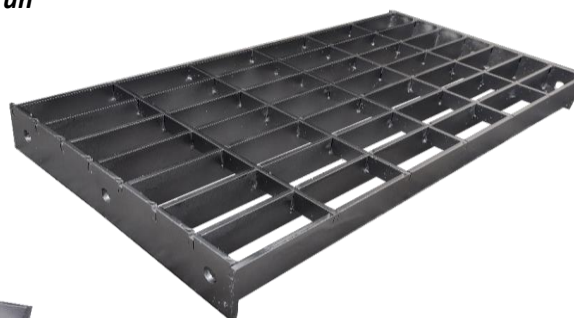
Escalones de Acero Inoxidable